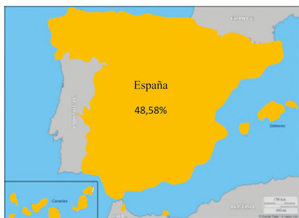
Gráfico 1. Distribución artículos por todo territorio nacional.